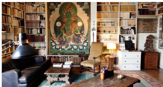
Vues du bureau de Claude Lévi-Strauss