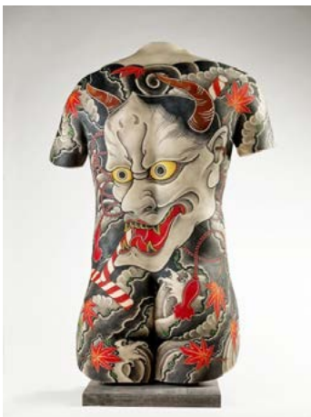
Volume Tatoué par Filip Leu.

Après une tournée internationale qui l'a menée au Natural History Museum of Los Angeles County en 2017, au Kaohsiung Museum of Fine Arts à Taiwan en 2019 ou encore au Pushkin State Museum of Fine Arts à Moscou en 2020, l'exposition Tatoueurs, tatoués est présentée au Mans, au Musée Jean-Claude Boulard, Carré Plantagenêt - Musée d'Archéologie et d'Histoire de la Ville du Mans, jusqu'au 2 mai 2021.