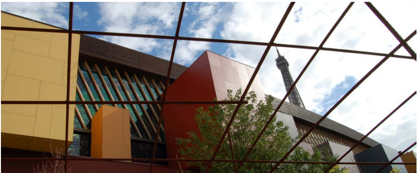
Vue du jardin et le bâtiment Musée. Juin 2007

Les fonds documentaires dans les collections